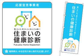
このステッカーとノボリが目印！

住宅市場活性化協議会が、福岡県内の不動産事業者（宅建業者）で「住まいの健康診断」の応援を宣言した事業者を登録する制度です。「住まいの健康診断」ホームページで公開中です。